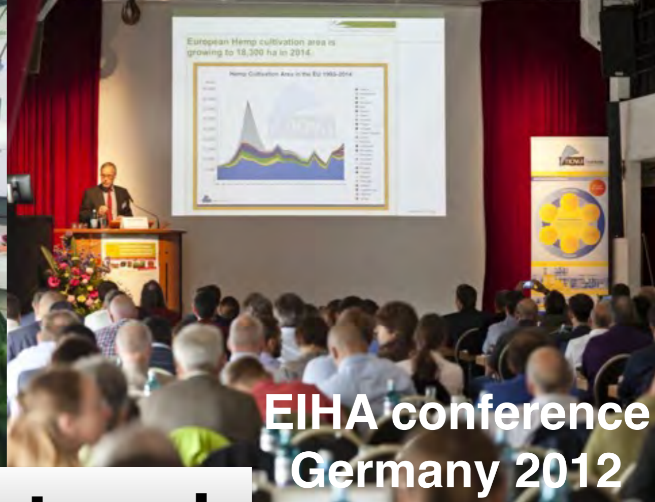
EIHA conference Germany 2012