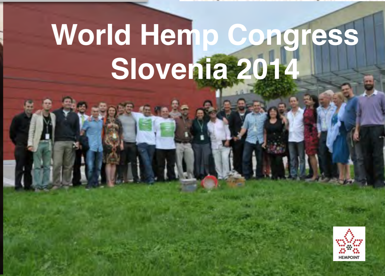
World Hemp Congress Slovenia 2014