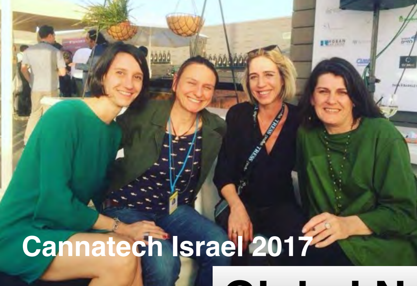
Cannatech Israel 2017